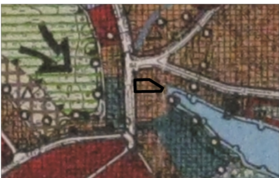
— granice obszaru objętego zmianą planu